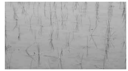
▲3～4本植えイメージ 平均3本/株