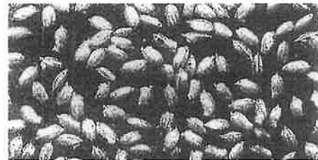
催芽籾150g(乾燥籾120g)播き【原寸大】