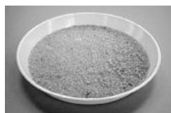
着色粒は白いカルトンで確認