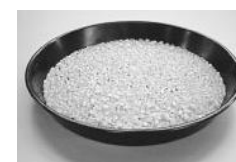
もみ混入は黒いカルトンで確認