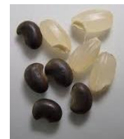
クサネム種子 (黒い粒:左)