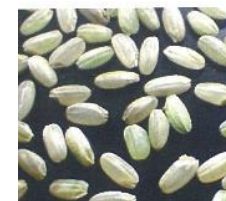
1.9mm以下の玄米品質は非常に低い