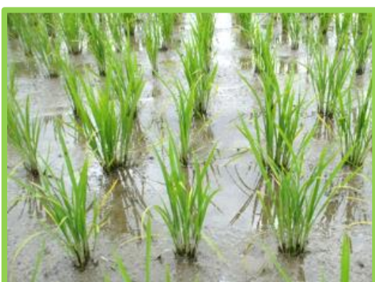
【中干し開始の目安の株】