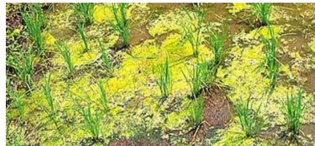
繁茂した藻 (アオミドロ)

図 田植え後の水管理のイメージ (※右写真のような水深ゲージをお持ちであれば、ぜひご活用ください。)