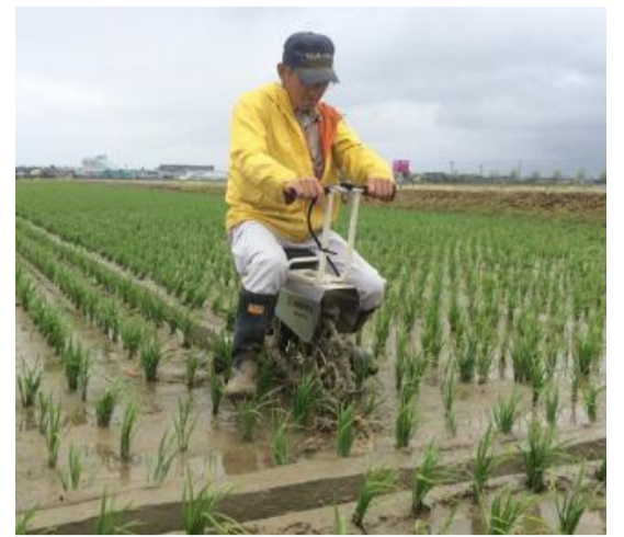
乗用溝切機を使用した溝切り