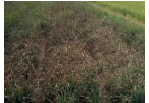
いもち病によりずり込む圃場