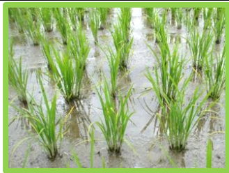
【中干し開始の目安の株】