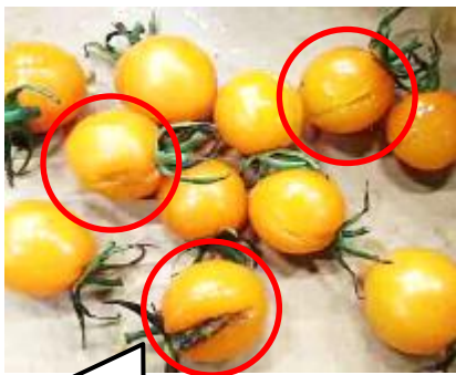
裂果からカビが発生