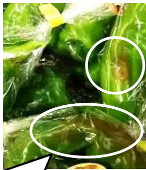
虫食い、変色は出荷しない