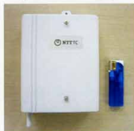
お客様宅取付機器

※この契約はJAのプロパンガスを利用いただいているお客様に限りますので、これを機会にJAのガスを利用してみてはいかがでしょうか。