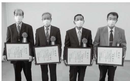
支店運営功労者表彰受賞の皆さん