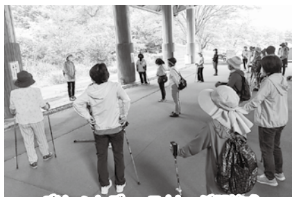
グリーンレディースカレッジ開校式

コロナ生活が一年も続くと体を動かす機会も減り、意識して運動をしない限り筋力や体力が衰えたと感じた部員も多かったようです。このウォーキングをきっかけに『歩く運動』を習慣づけたいものです。辰口丘陵公園なら近場なので気軽に通えそうですね。家族や友人で歩いてみてはいかがでしょうか。