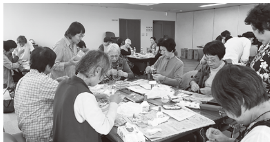
編み方を間違えないように集中しています

鍋敷きにするほか、写真などを覗かせて壁飾りとしても活用できると、指導者からアドバイス