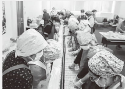
当日の朝、例年より多く練習しました!