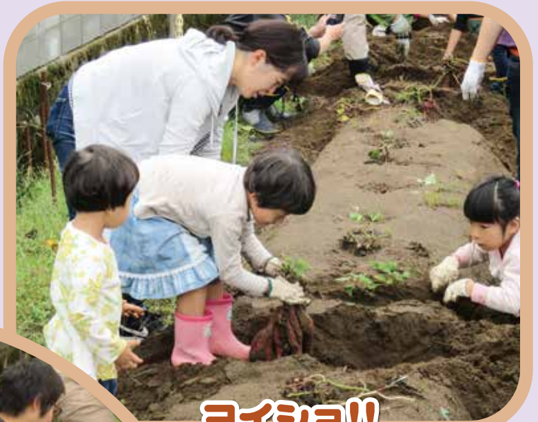
ヨイショ!! ヨイショ!!