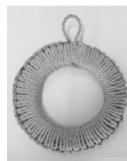
ベーシックな茶色の鍋敷きです (色は想像にお任せします)

皆さんも、来年こそは自作の手芸品を秋の収穫祭で出品販売してみたいかがでしょうか。