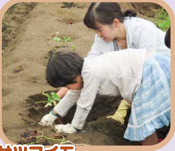
サツマイモ あるかな、あるかな～