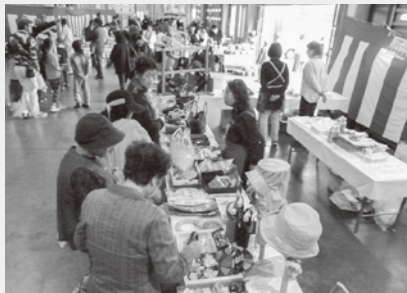
手作り手芸品は素敵なものばかり

今年の収穫祭は悪天候にも関わらず、 総勢95名の女性部員に「豚汁」「チャリティージャンボ太巻き寿司」 「手作り品販売」「女性部加工部会販売」の各コーナーでご協力をいただき、 誠にありがとうございました。心よりお礼申し上げます。