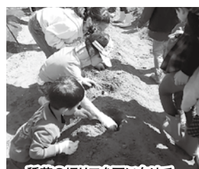
種芋の切り口を下に向けて...

女性部活動のひとつとして、管内のご家族を対象に食農体験プログラム『緑の学園』をスタートしました。赤井地区婦人の家の向かいにある畑に8組の家族が集合し、女性部員が作業方法などを指導しました。初回の3月9日(土)にスナップえんどう(豆)の苗を植え、4月6日(土)にはジャガイモ(種芋)を植えました。(えんどう豆は苗の生育が良すぎたため3月に急遽植えました。)小さなお子様やおじいちゃんおばあちゃんも参加して、楽しくにぎやかに作業しました。皆さんとても積極的なので、畝に黒マルチをかぶせる作業はアツという間でした。えんどう豆、ジャガイモの他にゴボウ、畑の隅にはひまわりの種もまきました。そしてこの畑が「緑の学園」だと分かるように皆で描いた看板も立てました。ぜひ近くを通った際は畑の様子を見て下さいね。