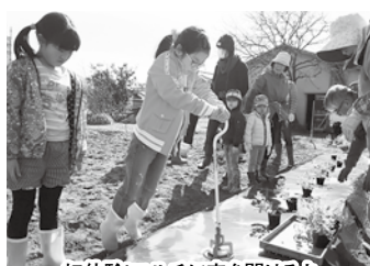
初体験! マルチに穴を開けるよ