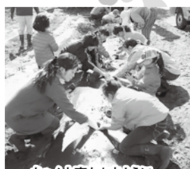
ちゃんと育ちますように...