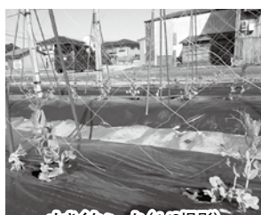
大きくなあ〜れ(4/6撮影)