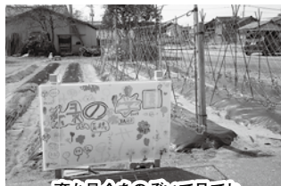
育ち具合をのぞいて見てね

女性部活動のひとつとして、管内のご家族を対象に食農体験プログラム『緑の学園』をスタートしました。赤井地区婦人の家の向かいにある畑に8組の家族が集合し、女性部員が作業方法などを指導しました。初回の3月9日(土)にスナップえんどう(豆)の苗を植え、4月6日(土)にはジャガイモ(種芋)を植えました。(えんどう豆は苗の生育が良すぎたため3月に急遽植えました。)小さなお子様やおじいちゃんおばあちゃんも参加して、楽しくにぎやかに作業しました。皆さんとても積極的なので、畝に黒マルチをかぶせる作業はアツという間でした。えんどう豆、ジャガイモの他にゴボウ、畑の隅にはひまわりの種もまきました。そしてこの畑が「緑の学園」だと分かるように皆で描いた看板も立てました。ぜひ近くを通った際は畑の様子を見て下さいね。