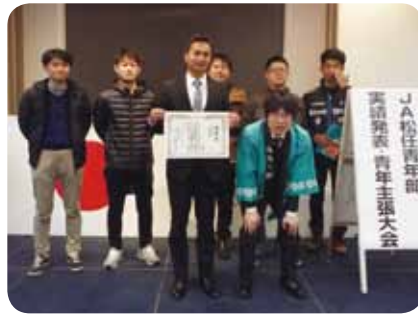
実績発表の部 最優秀賞の山島地区