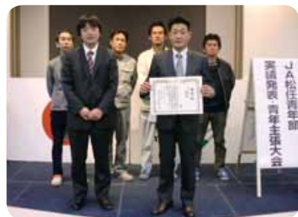
青年の主張の部 最優秀賞の林中地区