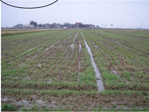
圃場内に停滞水が残っている状態