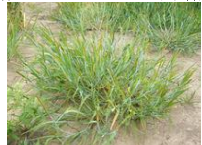
スズメノテッポウ