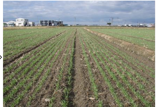
圃場表面水の排除を実施した状態