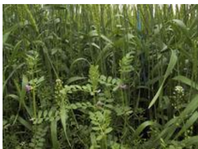
カラスノエンドウ

広葉雑草主体 : アクチノール乳剤 スズメノテッポウ主体 : ハーモニー75DF 水和剤