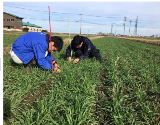
【茎数 480本/m 2 のほ場 やや生育不足】 〈裏面へ〉