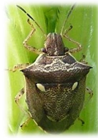
トゲシラホシカメムシ