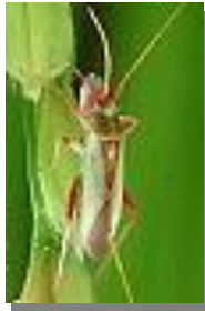
アカシジカスミカメ