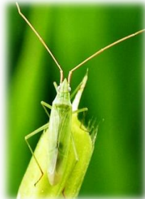
アカヒゲホソドリカスミカメ