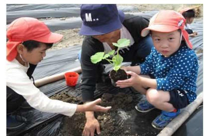
「保育園児とさつまいも定植」