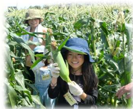
写真：親子わくわく農業体験