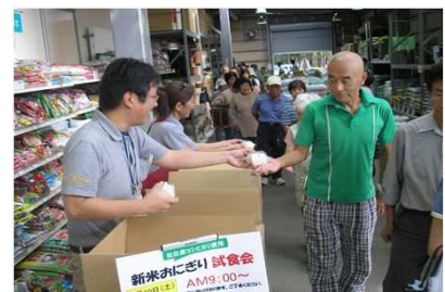
「新米コシヒカリおにぎり無料配布」

9月には、松任産新米「コシヒカリ」のおにぎり500個を、来店されたお客様に無料配布し、松任産米のPRを行いました。