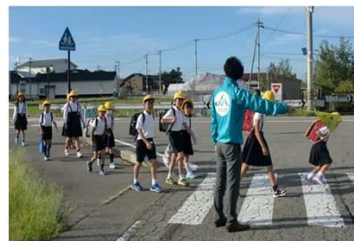
「交通安全運動への参加」