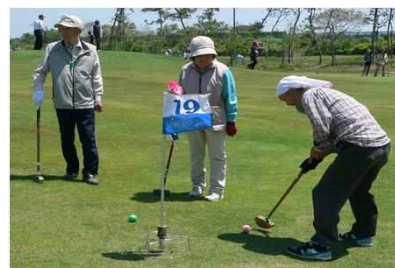
「グラウンドゴルフ大会」