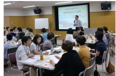
「女性大学『あさ姫スクール』」