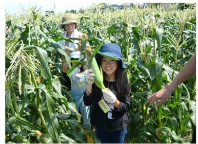
「親子わくわく農業体験」

計5回の体験を通じて、トウモロコシ・さつまいも等の野菜を収穫したり、カントリー等の施設見学、地元野菜のカレー試食等、親子で楽しみながら農業を学びました。