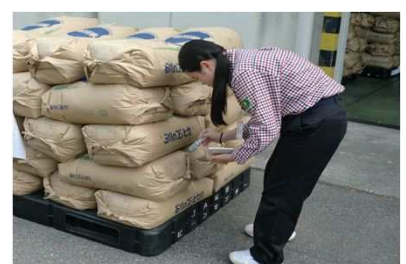
「高校生の体験学習」