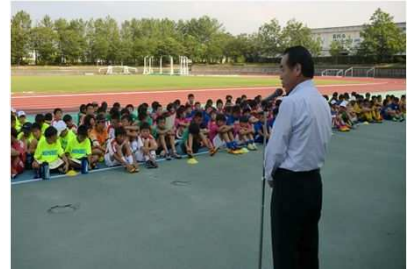
「少年サッカー大会」

○ 子供たちの健やかな成長と少年スポーツの活性化を目的に、「少年サッカー大会」、「少年野球大会」の後援・協賛をしました。