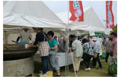
「緑と花のフェスティバル」

○ 「緑と花のフェスティバル」では、大鍋めった汁、約1,000杯分を振る舞い、来場者の方に好評でした。