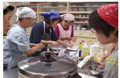
「女性の会（料理クラブ）」

○ 女性の会の活動として、家庭菜園クラブ、着付けクラブ、パソコンクラブ、ガーデニングクラブ、料理クラブ、アクアビクスクラブなどを開催しています。