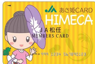
「総合ポイントあさ姫カード」