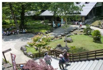
「さわやか健康ウォーキング新穂高」