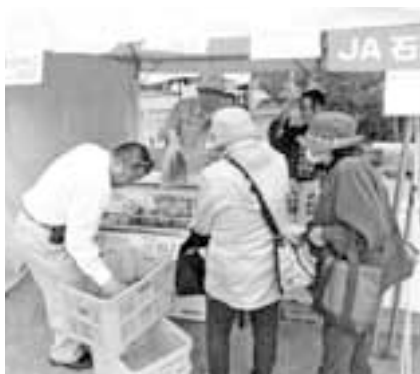
タケノコを求める来場者