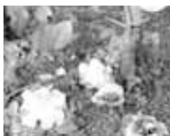
図3 落ちた花は拾い集める