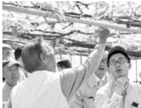
確認し合う生産者と砂丘地職員

三日遅いもようです。続いて、砂丘地農業研究センター職員からデラウエアのジベレリン処理を行う適期のタイミングについて、職員と生産者が圃場で確認し合い、その後生産者から意見や質問が飛びかうなど生産者の姿勢は真剣。