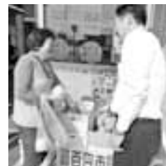
会話を楽しむ来店者と職員

今後も年金受給日にあわせて開催。十二月にはめつた汁を二月にはもちつきをふるまう予定です。