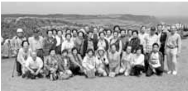
「与那国島」東崎(あがりざき)にて

島は本島と橋で結ばれており、「メラルドグリーン」の海、「美しい海岸線」、「白い砂浜」、「珊瑚礁」など宮古島特有の壮大な景色に参加者から歓声が湧き、日々の生活からの開放感に浸っていました。また、農産物直売所JAあたらす市場では、新鮮な野菜の品数と値段の安さに驚きました。