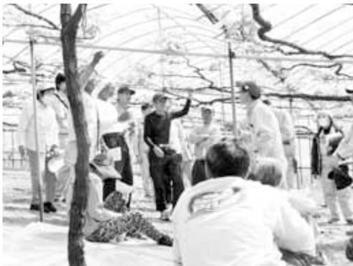
受講する生産者の姿勢は真剣

今年の生育では、二月から四月初めの気温が低かったことが影響してバラつきがあり、例年より二