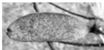
図4 ツツジグンバイムシの被害（左）と成虫（右）

が透明で黒い模様があり、姿が相撲の軍配に似ているところから名が付きましました。五月頃から葉の裏で群生して葉を吸汁し、吸汁箇所はつやがなく白いカスリ状の白斑となります。葉の裏には小さなタール状の黒色糞が付着して残ります。ツツジには大概発生します（図4）。