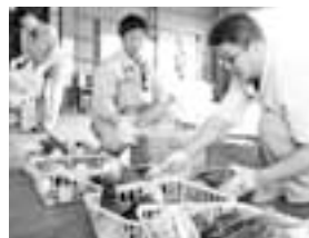
箱詰め作業をする職員

ただ今年は収穫量が少ない「裏年」にあたるほか、イノシシによる食害報告がされています。出荷されたタケノコは、市場の他、JAグリーンかほくの店頭で販売されたほか、津幡町の学校給食にも供給されました。