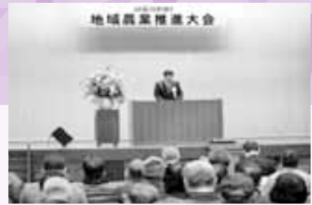
先だって行われた地域農業推進大会

このことについては、平成31年5月までの間、JA自己改革の実施状況について政府からフォローアップされることとなります。