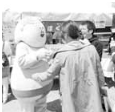
来場者とふれあう「ほくの里」