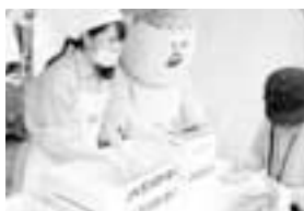
つきたての餅を手渡すJA職員と「ほくの里」

きたての餅を丸め、きな粉をつけて手渡しました。餅を求める多くの来場者に当JAキャラクター「ほくの里」も手渡しする様子は子ども達にも人気でした。チャリティーで寄せられた募金は、かほく市福祉協議会等へ寄付されました。