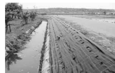
防草シート(内日角)