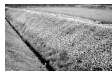
ヒメイワダレソウ