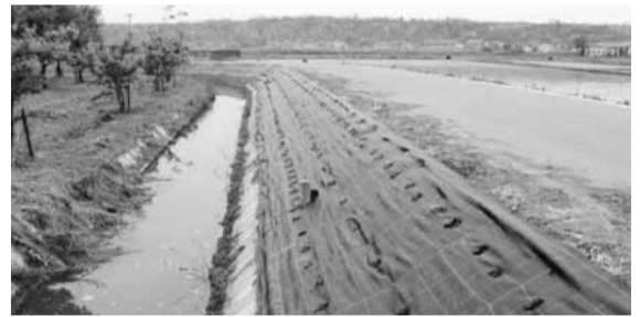
防草シート (内日角)