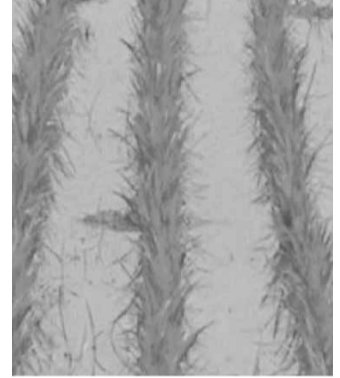
写真：中干し開始適期 コシヒカリ 13本/株