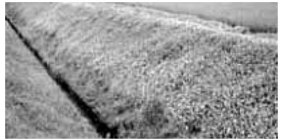
ヒメイワダレソウ