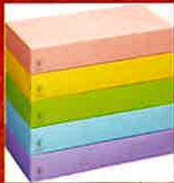
ボックスティシュー 5個組