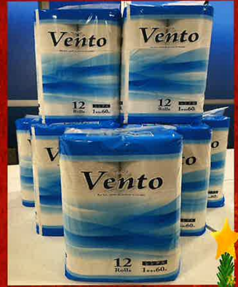
12ロール入り トイレロール8袋