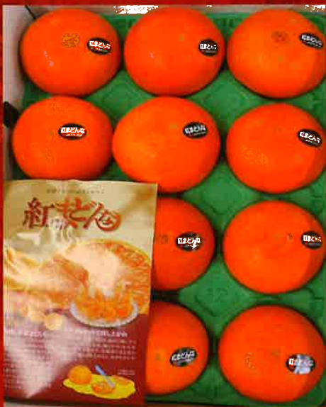
高級みかん 紅まどんな