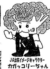
JA加賀イメージキャラクター カガッコリーちゃん