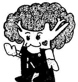
JA加賀イメージキャラクター ガッコリーちゃん