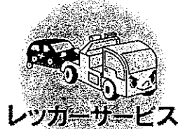
レッカーサービス

事故または故障により 自力走行不能となった場合に レッカー車で現場に急行し、 最寄りの修理工場等まで お車をけん引します。