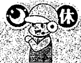
夜間休日 現場急行サービス

JAの営業時間外にJA共済事故受付センターへご連絡いただいた事故について 対応員が事故現場に急行し、事故状況の聞き取りなどを行います。