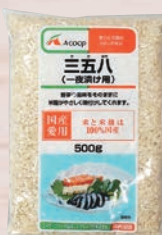
Aコープ 三五八 500g