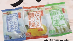
ベジフレンド べったら漬の素 30g×3