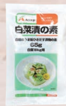
Aコープ 白菜漬の素 65g