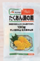
Aコープ たくあん漬 の素 130g