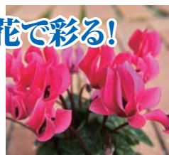
ガーデンシクラメン