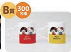
笑味ちゃんxハローキティ オリジナルペアマグカップ

JA直売所で税込1,000円以上お買い物したレシートを 「JA直売所キャンペーンLINE公式アカウント」に送ろう!