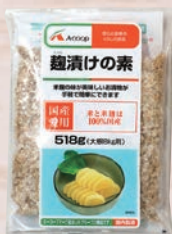
Aコープ 麹漬の素 たくあん漬用 836g・518g