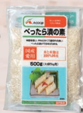
Aコープ べったら漬の素 500g