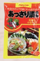
ベジフレンド あっさり漬の素 30g×4