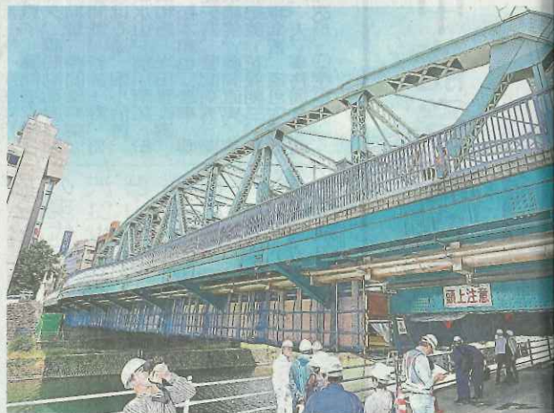
金沢市中心部の大動脈としての役割を果たす