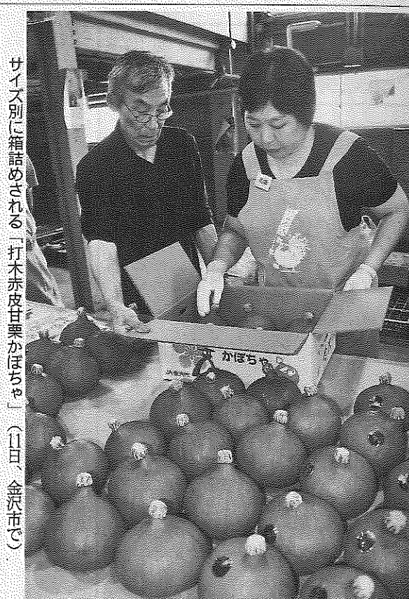
サイズ別に箱詰めされる「打木赤皮甘栗かぼちゃ」(11日、金沢市で)