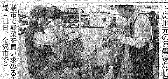
朝市で野菜を買い求める主婦(11日、金沢市で)

中央の「ふれあい朝市」が11日、金沢市の二塚支店で始まった。8月中旬まで全6支店で週1回開き、生産者との連携や地域の交流、JAの活性化に取り組み。二塚支店は夕市も新設する。昨年からは始まり、2年目。初日は支店前のテニ